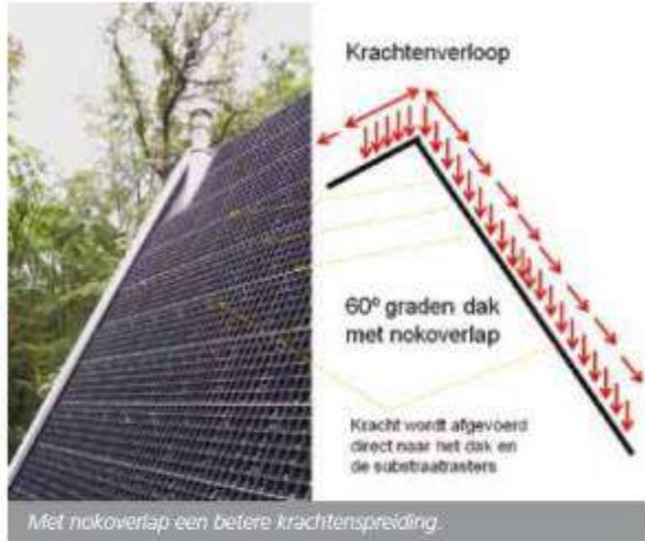
Met nokoverlap een betere krachtdispersie.