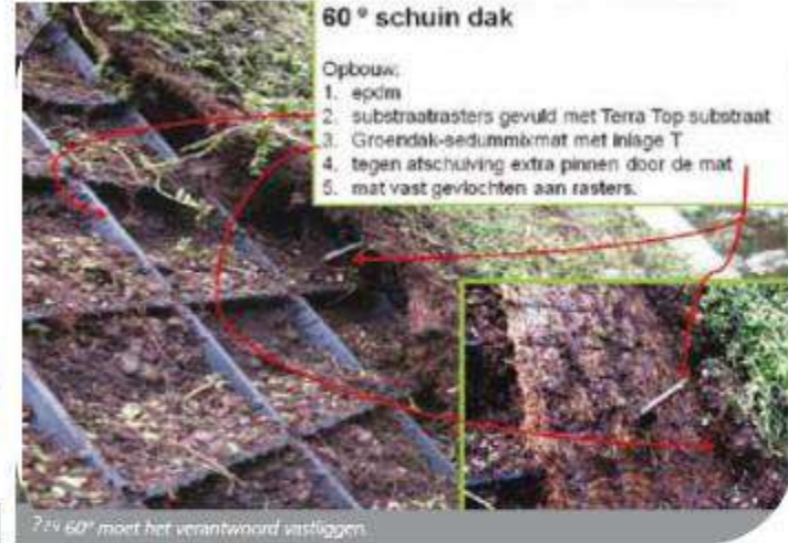
7/9 60° moet het verantwoord vastleggen.

Hellend groen is een vak apart Het beperken van de gewichtsbelasting en afschuifkracht is een 'must' op schuine daken