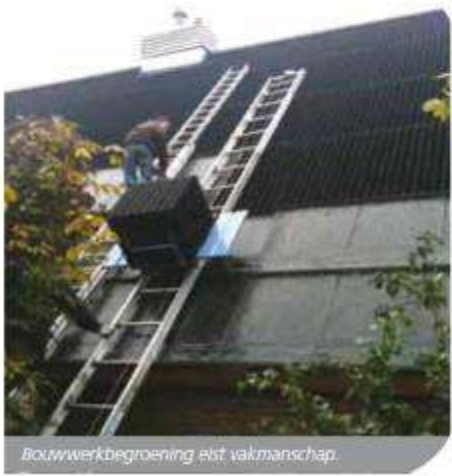
Bouwwerkgroening is vakmanschap.